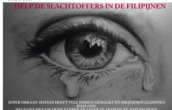
foto van een schilderij van een Filipijnse au pair van de familie

Een gezin van school heeft het initiatief genomen de handen ineen te slaan voor een actie voor de Filipijnen. Zij zijn al gestart en hebben school gevraagd of zij hun actie breder kenbaar mochten maken aan alle ouders van school. Hieronder het verzoek.