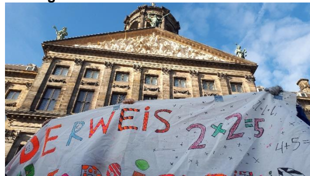
Een spandoek van groep 8a voor het paleis op de Dam met de expres fout geschreven tekst: