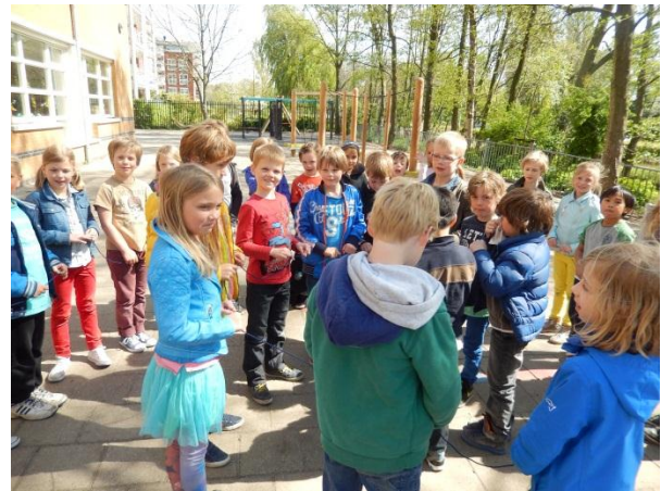
levend labyrint, verbonden met een draad

In groep 4a is gewerkt met verhalen uit de methode 'Hemel en Aarde', waarbij stiltemeditatie een rol speelde. Het ging om de 'stille verhalen': Petrus is stil en Maria is stil. De kinderen vonden dit erg indrukwekkend. Ook hebben groepen (kleuters en groep 4) op het schoolplein in een labyrint gelopen.