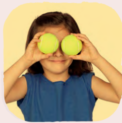
sport en spel