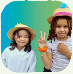
meiden op vrijdag