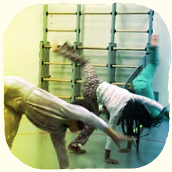
zang & dans